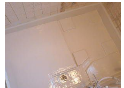
※床材等施工しない場合は