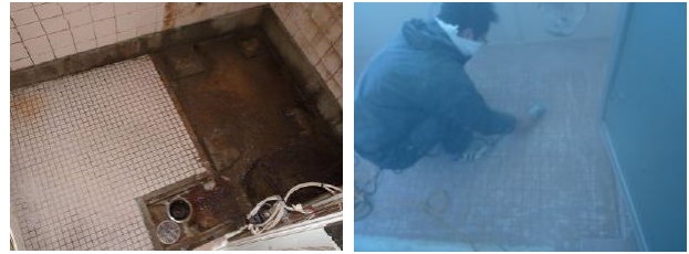
音 研磨時は音及び粉じんがでます