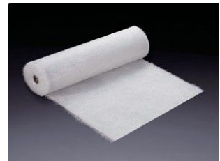
FRP 防水用ガラスマット